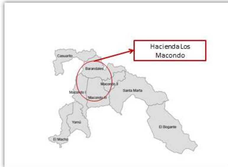
Mapa 3. Predios de la red corporativa y aliados de Poligrow

Elaboración SOMO-INDEPAZ con base en certificados de libertad y tradición, escrituras públicas y bases del IGAC.