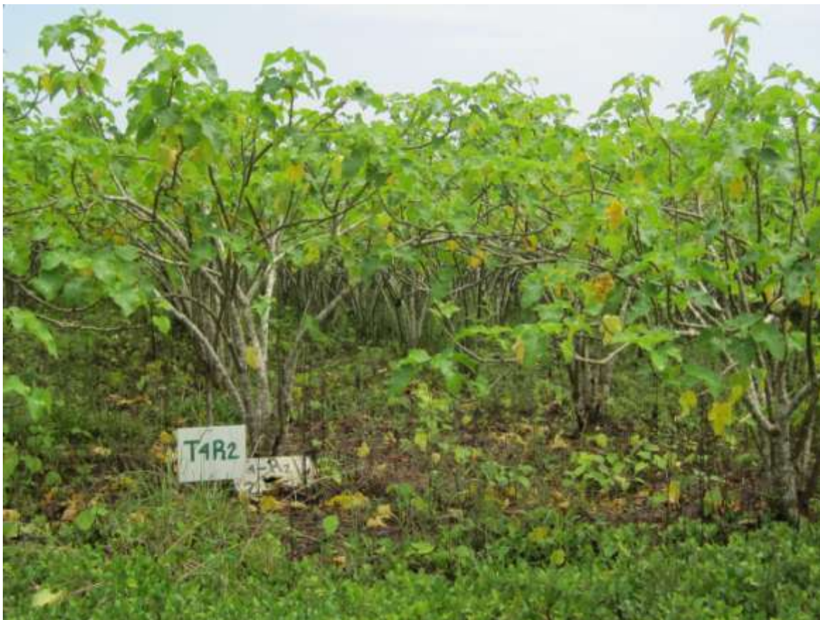
Foto 4. Cultivos de jatropha en la plantación Los Macondo.