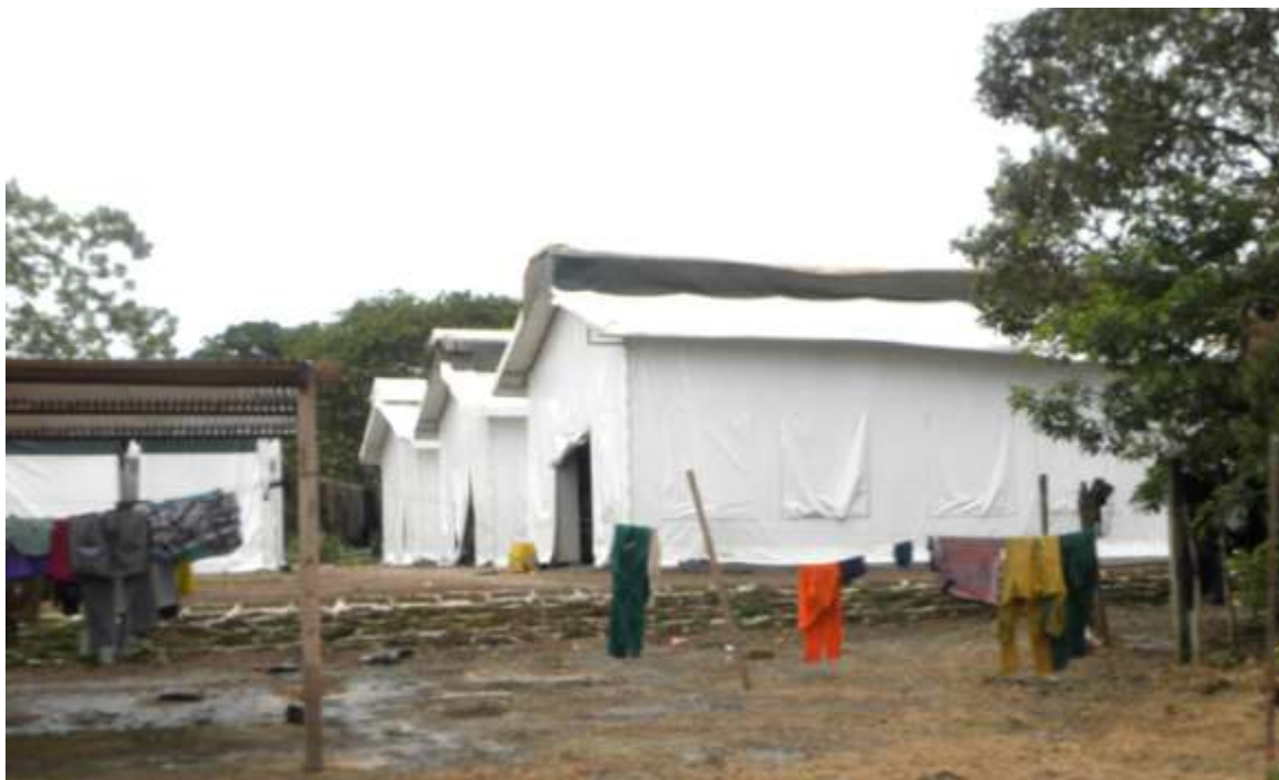
Foto7. Campamento de trabajadores en la plantación Los Macondo.

En Mapiripán no se han constituido sindicatos ni organizaciones de trabajadores debido a la percepción de que la “empresa es muy fuerte” y “que los trabajadores no saben de leyes para defender sus derechos”. 488 Las quejas y reclamos se tramitan ante una dependencia de la Fundación Poligrow en Mapiripán y, en ocasiones, se presentan ante la Personería Municipal. 489