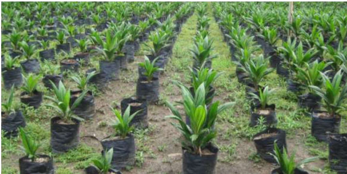
Foto 1. Plántulas en la plantación Los Macondo.

Poligrow promueve alianzas estratégicas con personas naturales y jurídicas que le venden la totalidad del fruto producido. A través de esas alianzas se pretende “transferir conocimiento y experiencia técnica”, así como garantizar que los socios “cumplan con estrictas reglas de sostenibilidad ambiental”. 205 En esa línea los aliados reciben asistencia técnica para la siembra de las plántulas y el mantenimiento y cuidado de los cultivos.