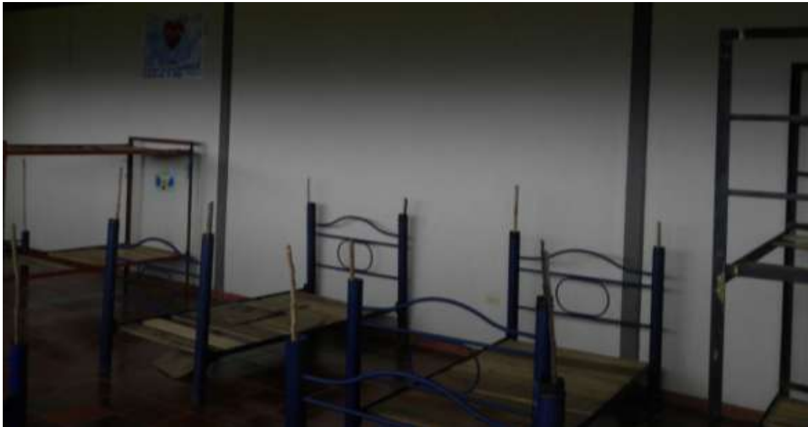
Foto 3. Colegio Jorge Eliecer Gaitán en Mapiripán.

Como parte de la RSE, la Fundación Poligrow promueve las huertas caseras y escolares; las semanas ambientales con madres comunitarias y estudiantes del colegio Jorge Eliecer Gaitán; el patrocinio de carreras tecnológicas en el Instituto Politécnico Agroindustrial de Villavicencio; actividades de capacitación con el Sena; apoyo a la emisora radial del municipio y a campeonatos deportivos, y actividades con los indígenas, especialmente con los Jiw. 230