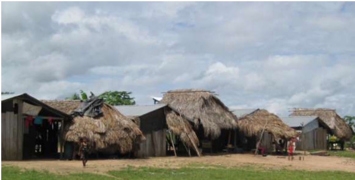
Foto 8. Viviendas indígenas Jiw en Las Zaragozas.

En febrero de 2015, indígenas Jiw reiteraron no conocer el protocolo ni actas de reuniones que den cuenta de su implementación, y los permanentes incumplimientos de los compromisos asumidos por Poligrow desde su llegada. 494