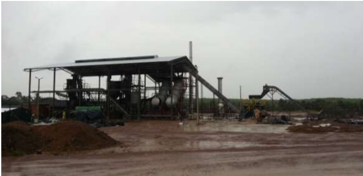
Foto 2. Planta extractora en la plantación Los Macondo.

En septiembre de 2014 se terminó de construir la planta extractora piloto en la plantación Los Macondo , con capacidad de procesar siete toneladas RFF/H de fruto de palma cada hora. 223 La construcción de la segunda planta está supeditada a tres circunstancias específicas: el cumplimiento de la meta de 15.000 hectáreas sembradas a 2016; los avances del corredor intermodal que facilite la salida del aceite de palma hacia los puertos en el Pacífico y el Atlántico; y la instalación de la Zona Franca Permanente Especial solicitada por la sociedad Poligrow Agroindustrial S.A.S. 224