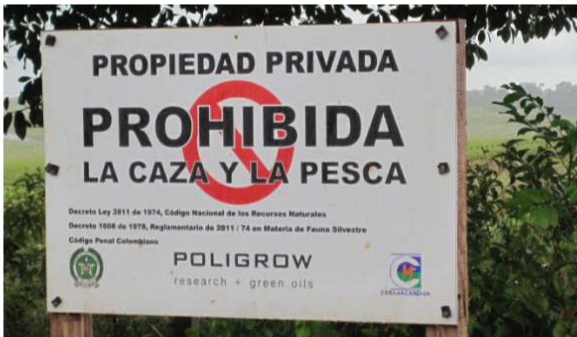
Foto 5. Aviso de prohibición de caza y pesca.