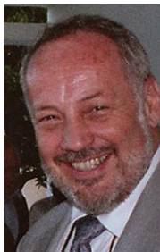
Eric Sottas Secretario General de la OMCT

M anifestaciones reprimidas, sindicalistas detenidos, ONG vigiladas: desde hace años estas realidades están vinculadas a situaciones económica y socialmente desequilibradas e injustas. El crecimiento de las inconformidades sociales vinculadas a la crisis económica mundial ha hecho crecer la represión registrada en los últimos años. El aumento de las prácticas y de las leyes liberticidas en materia de control de la sociedad, inversamente proporcional a la caída de las bolsas, es una de las principales características de las dificultades enfrentadas por los defensores de derechos humanos en 2008. (...) Se ha intensificado la criminalización de la protesta social, afectando cada vez más a los países llamados democráticos. Una situación tanto más inaceptable por cuanto duplica el número de ataques sufridos por todas las demás formas de protesta pacífica frente a las políticas gubernamentales que tienen un impacto sobre los derechos humanos.